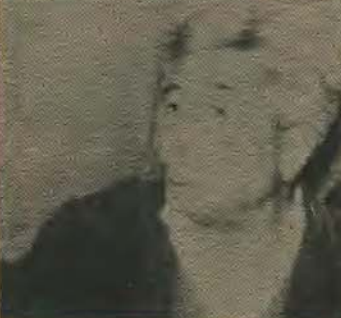
Χωρίς να αγωνιστομε εμεις οι ίδιοι εν μās άνοει κανένας. Πρέτει ούλλοι, πρόσφυγες και μη να αμείουμε τζιαι να φωνάζουμε. Πρέτει να βουεις στους δρόμους, να κάμεις απεργια, για να βρής το δικαιο σου, άδελφίη να πάεις στο σπίτι σου.